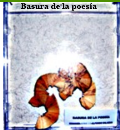
Basura de la poesía