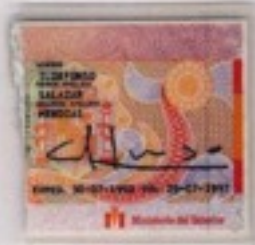
La mitá de la vida